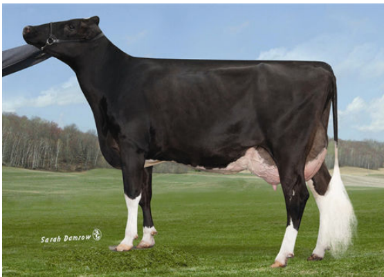
K-MANOR ALEX SIMPLICITY Dam